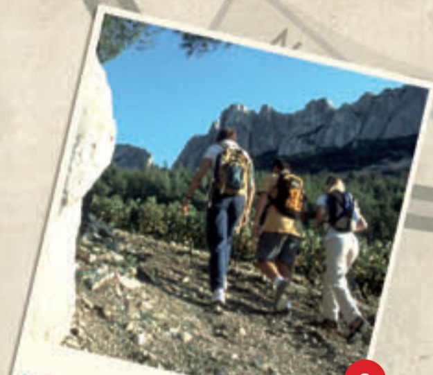
Les sentiers balisés de Gigondas / Gigondas hiking trails

40 km de sentiers balisés sillonnent le Massif des Dentelles de Montmirail. Une carte avec 5 circuits de découverte, tous publics, au cœur du Massif vous est proposé, sous forme de boucle, partant de la Commune de Gigondas pour finalement y revenir. De plus, 3 circuits V.T.T. parcourent le massif. Des sites d'escalades (plus de 650 voies) et un parcours aérien sont également accessibles à partir de Gigondas.