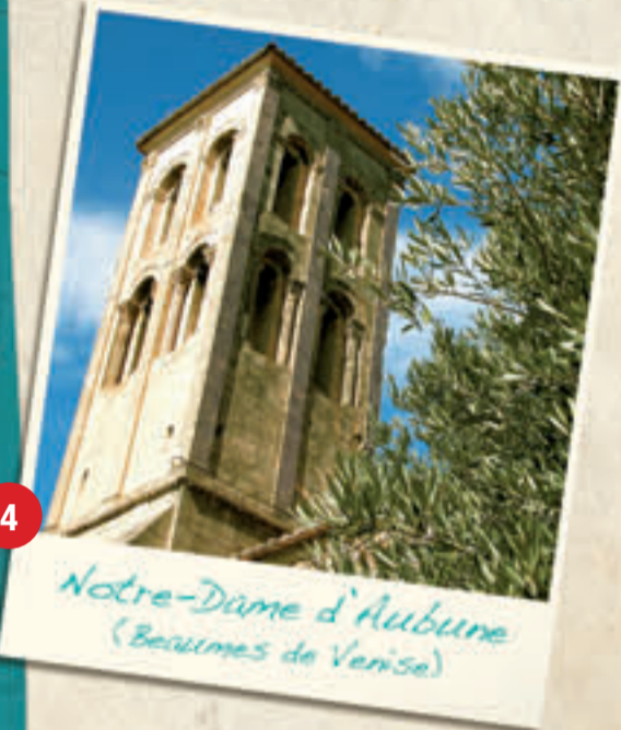
Notre-Dame d'Aubune (Beaumes de Venise)

Classée monument historique, Notre-Dame d'Aubune est une chapelle dédiée à la protectrice du village de Beaumes-de-Venise. La légende raconte que La Vierge est intervenue lorsque le Malin a voulu détruire le monument religieux à l'aide d'un rocher surplombant celui-ci. Le rocher, toujours présent, est appelé le "Rocher du Diable" en raison d'une "griffure" qui en serait son œuvre. Il est possible de voir la chapelle à 1km du village, en direction de Vacqueyras. A listed historic monument, Notre-Dame d'Aubune is a chapel dedicated to the protector of the village of Beaumes-de-Venise. Visits can be made to the site on the hill situated behind the village in the place called the Rocher du Diable (the Devil's Rock) because a scratch which would be his work. It is possible to see the chapel only 1km from the village, in the direction to Vacqueyras.