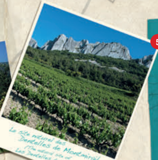
Le site naturel des Dentelles de Montmirail / The natural site of the Dentelles de Montmirail

Issues du choc titanesque, entre le colosse pyrénéen et son jeune rival alpin, les Dentelles crénelées de Montmirail offrent de nombreux sentiers de randonnées. Ses falaises abruptes pouvant parfois atteindre 100 mètres font la joie des amateurs expérimentés de varappe. Gigondas est la porte d'accès vers le Massif des Dentelles de Montmirail, situé à 90% sur cette commune. Caused by a massive shock, between the Pyrenean colossus and its young Alpine rival, the crenellated Dentelles de Montmirail offer numerous walks and trails. Their steep cliffs, which can sometimes reach a height of 100 metres, give a lot of pleasure to rock-climbing enthusiasts. Gigondas is the door of access towards the Massif of the Laces of Montmirail, situated in 90% on this municipality.