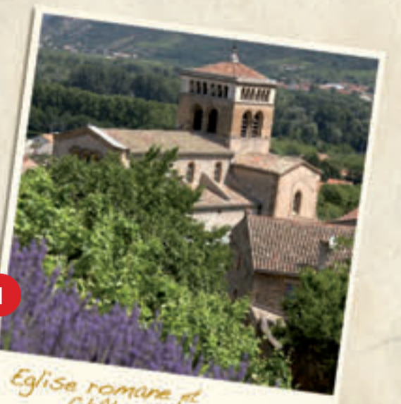
Eglise romane et Château d'Isérand à Vion / Eglise romane et Château d'Isérand à Vion

Built in the 11th century, the choir and the crypt of this magnificent estate are classified as an historical heritage. Inside, arches and byzantin capitals stand side by side with elegant columns covered with coloured ceilings. Guided tour all the year round by appointment. Hiking « Ruine du Château d'Isérand ».