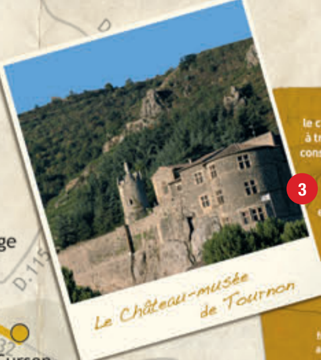
Le Château-musée de Tournon

Edifié entre le Xe et XVIe siècle, le château de Tournon offre un véritable voyage à travers le temps. C'est un musée aujourd'hui consacré à l'histoire de la seigneurie de Tournon au Moyen âge ainsi qu'aux arts et techniques du XIXe et XXe siècle avec une salle dédiée à la batellerie et aux artistes régionaux. Sans oublier un très beau panorama des deux terrasses sur les coteaux ou la vieille ville. Build between the 10th and the 16th century, the castle of Tournon offers a real travel through the time. Dedicated to the lords of Tournon's history during the Middle Ages and also to the arts and technical heritage from the 19th century, with a Rhône River room and local artists' exhibitions. The visitor can see a beautiful panoramic view from 2 terraces.