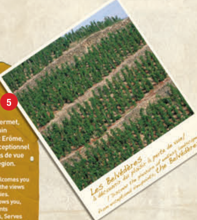
Les Belvédères / Bienvenue au pays de Tain l'Hermitage

Le pays de Tain l'Hermitage vous accueille et vous invite à la contemplation à travers ses coteaux et balcons. Le circuit des Belvédères vous permet, avec des départs multiples de Tain l'Hermitage, Gervans, Servas, et Erôme, de randonner à travers cet exceptionnel vignoble et d'avoir des points de vue uniques sur cette belle région. The region of Tain l'Hermitage welcomes you and invites you to contemplate the views of the hills from its balconies. The circuit of "Belvederes" allows you, with multiple starting points from Tain l'Hermitage, Gervans, Servas and Erôme, to walk across these exceptional vineyards and enjoy unique views of this beautiful region.