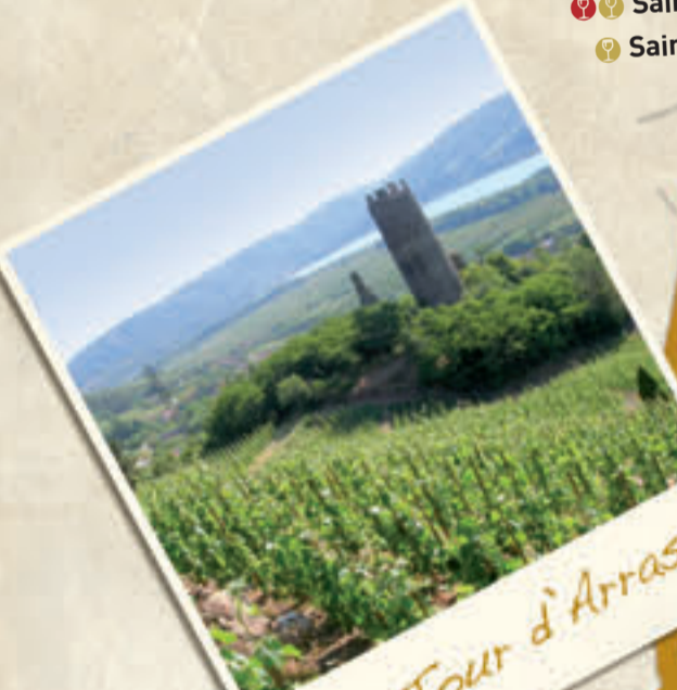
La Tour d'Arras

Dominant le village depuis des siècles, la tour blanche d'Arras était une tour d'observation à laquelle s'ajoutait une enceinte. Autrefois un château gardait ici la frontière du royaume et permettait de surveiller l'autre rive du Rhône. Prenez garde, on dit que le fantôme d'un cavalier réfugié dans le château apparaît encore chaque nuit près de la Tour.